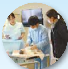
看護学科2年課程 (定時制)