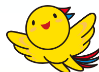
兵庫県マスコット 「はばタン」