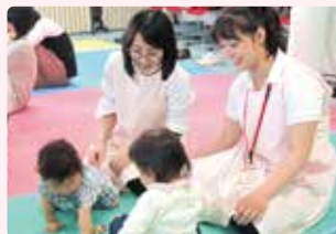
地域母子保健実習