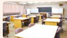
ファントム実習・歯科保健指導実習室