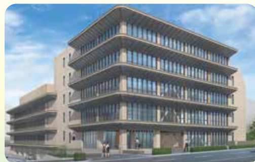
兵庫県立総合衛生学院 中山手分校外観