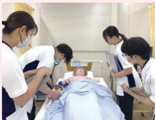
シミュレーター演習

基礎看護学 地域・在宅看護論 成人看護学 老年看護学 小児看護学 母性看護学 精神看護学 看護の統合と実践(医療安全・災害看護・看護研究・看護管理・統合演習) 臨地実習(基礎I・II、地域・在宅、成人・老年、小児、母性、精神の各看護学・統合実習)