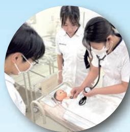
看護学科2年課程 (定時制)