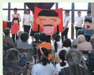
特別養護老人ホーム 保健指導実習