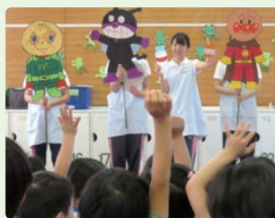
保育所保健指導実習